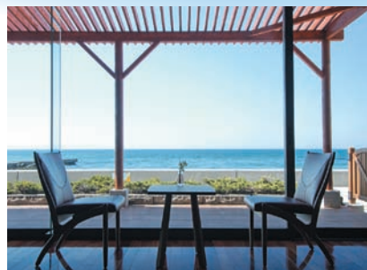
「しおさい亭 別館 花月」ロビーテラス