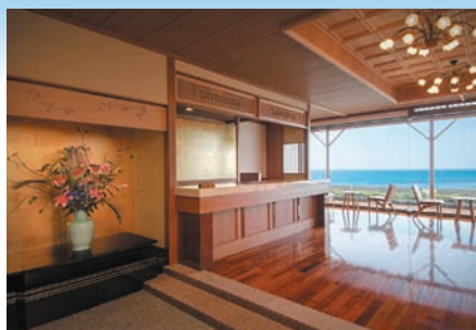
「しおさい亭 別館 花月」フロント