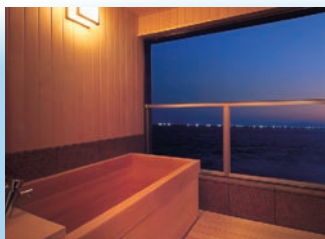
「おさい亭 別館 花月」客室露天風呂