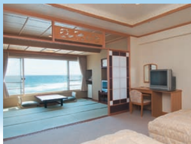
「しおさい亭 別館 花月」露天風呂付 洋室＋お食事処