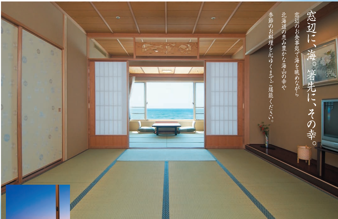
「しおさい亭 別館 花月」露天風呂付 和室＋お食事処