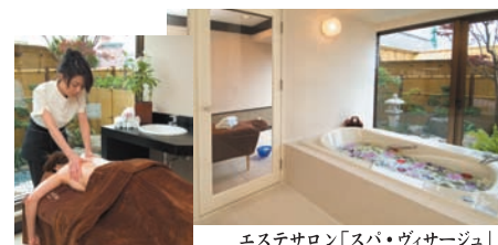
エステサロン「スパ・ヴィサージュ」