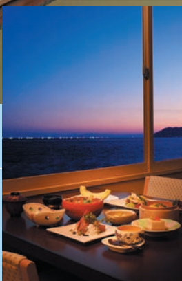
「しおさい亭 別館 花月」お食事処