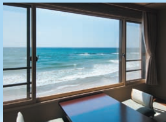
「おさい亭 別館 花月」お食事処

海に面したお部屋全室に 新しく檜の露天風呂。 海鳥の鳴き声や潮騒を聞きながら、 夜には波間に 月や遠くに浮かぶ漁り火を、 そして朝には まぶしいほどの海のきらめきを。