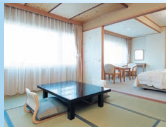
「しおさい亭 別館 花月」和洋室