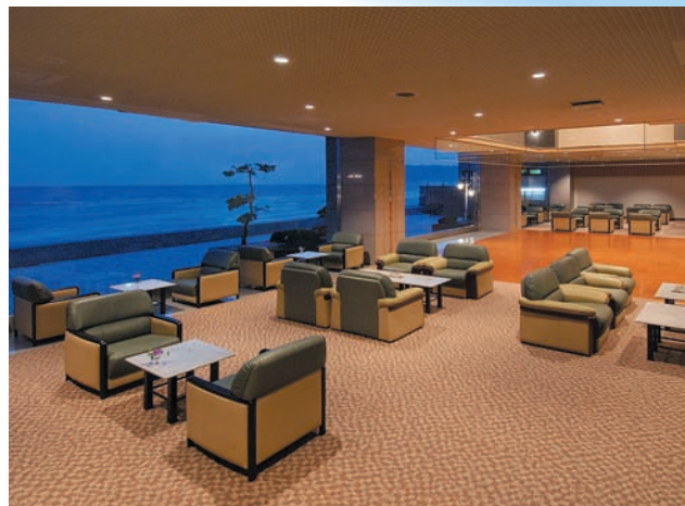
ラウンジ「シーガル」