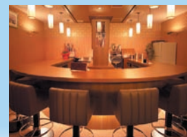
ナイトラウンジ「ハーフムーン」